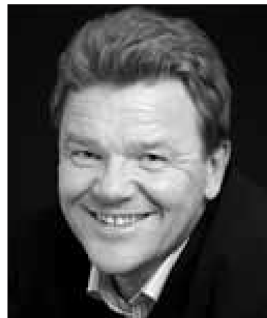
Øystein Djupedal er kunnskapsminister i sittende regjering.

God norskopplæring er avgjørende for at minoritetsspråklige barn skal lykkes i det norske samfunnet og finne en trygg plass i samfunns- og arbeidsliv. Samtidig er kulturelt mangfold og flerspråklighet viktige ressurser som minoritetsspråklige barn tilfører samfunnet. Jeg ønsker i dette innlegget å si litt om situasjonen for yngre minoritetsspråklige barn i barnehage og grunnskole og regjeringens innsats for barna, med fokus på språkopplæring.