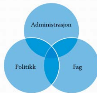
Figur V: 3 Samhandling i skoleeierskapet kommune 3

Det er fortsatt en pågående dialog mellom aktørene i skolene, nå bygd på kunnskap og erfaring. Strategiplanen, som er skapt i fellesskap, er en ramme som gir ringvirkninger av trygghet og aktiv deltakelse på tvers i sektoren.