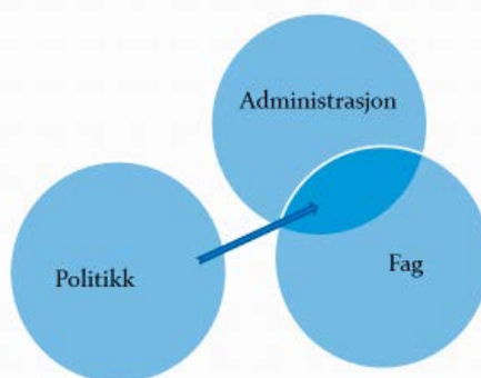
Figur V: 1 Samhandling i skoleeierskapet kommune 1

Har fått nye forventninger – til at politikerne skal være en aktiv skoleeier! Vi må da se på systemet om det må endres noe der!