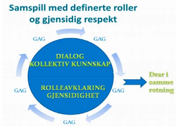
Figur V: 4 Samhandlingsmodell (Hartman, 2015)

av to parter, politikk og administrasjon, som er i et gjensidig avhengighetsforhold . Å lykkes i lag handler om at partene fungerer som komplementære krefter, der likeverdighet og gjensidig