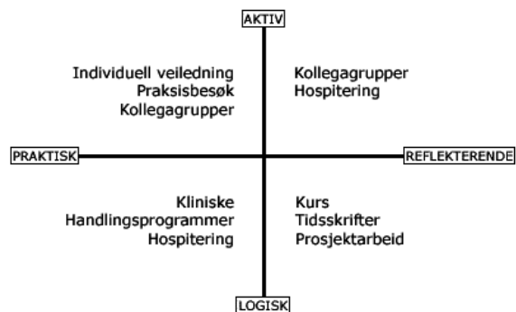
Figur 3 etter Pedersen m.fl. 2001

Læring skjer på forskjellig vis hos ulike mennesker. Etter hvert innarbeider man seg en personlig læringsstil og man utvikler læringsstrategier tilpasset egne læringspreferanser 5 . Noen har sin styrke i refleksjon og logisk tenkning, mens andre lærer best ved å handle, ved aktiv prøving og feiling. Det er gjennom den personlige utdanningen og individuelle arbeidserfaring man utvikler sin egen læringsstrategi under en lang forutdanning. Deltakelse i kollegagrupper, veiledningssituasjoner eller praksis, faller gjerne naturlig for den som har en aktiv og praktisk læringsstil. Den som foretrekker passive læringsformer og logisk reflekterende tenkning trives ofte best med forelesninger og selvstendig lesing. Kjennskap til personlige læringsstil kan hjelpe den enkelte deltaker å forbedre sin egen yrkeslæring. Sammenhengen mellom personlig læringsstil og tilbud i utdanningen er vist i figuren under. Dette er utdypet og eksemplifisert i heftet om Strategisk læring (Pedersen m.fl. 2001)